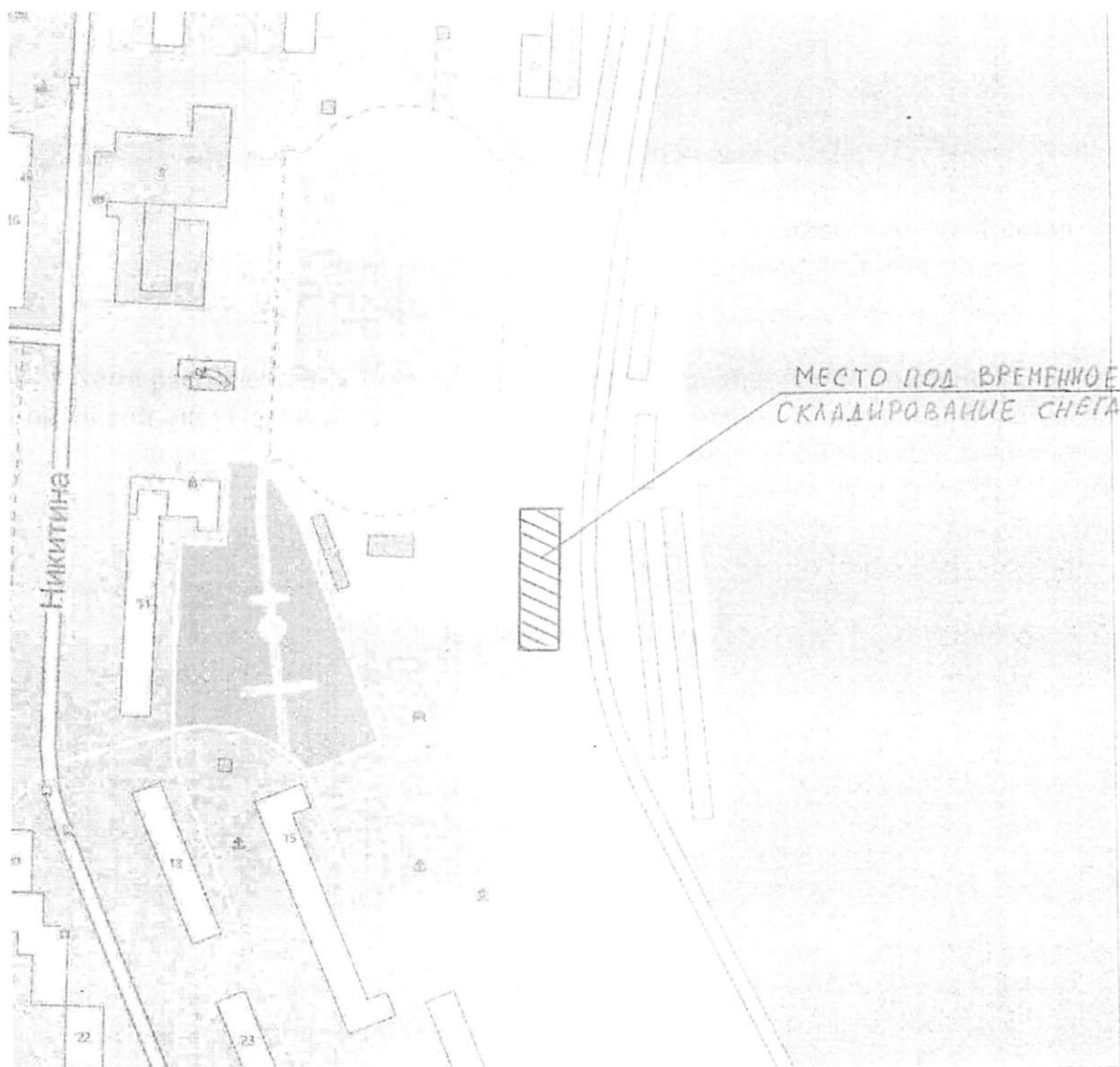
Схема расположения места под временное складирование снега по адресу: городской округ Жигулевск, г. Жигулевск, микрорайон Яблоневый Овраг между объездной дорогой на АО «ЖСМ» и улицей Никитина в 250 метрах от дома №15 по ул. Никитина

к постановлению администрации городского округа Жигулевск от « 17 » 11 2020 г. № 212д